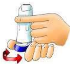
Cargar la dosis