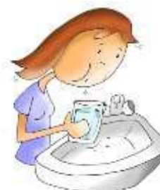
Enjuagar la boca

Ilustraciones: Patxi Velasco Fano, Alfonsa Lora Espinosa.