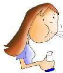
Expulsar el aire