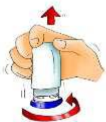
Desenroscar la tapa